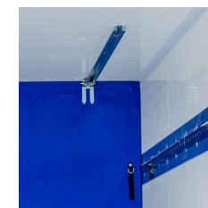
Sistema de movimentação trilho no teto ou lateral